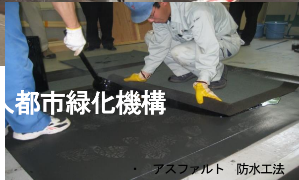
・アスファルト 防水工法