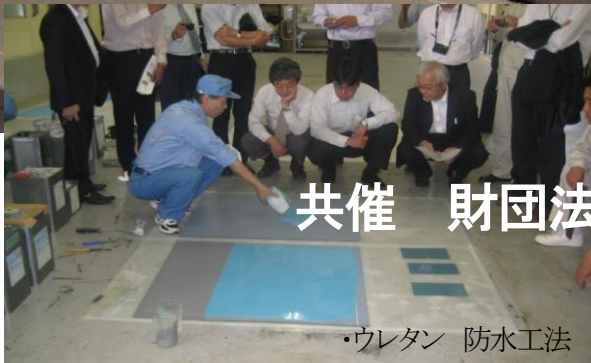
・ウレタン 防水工法